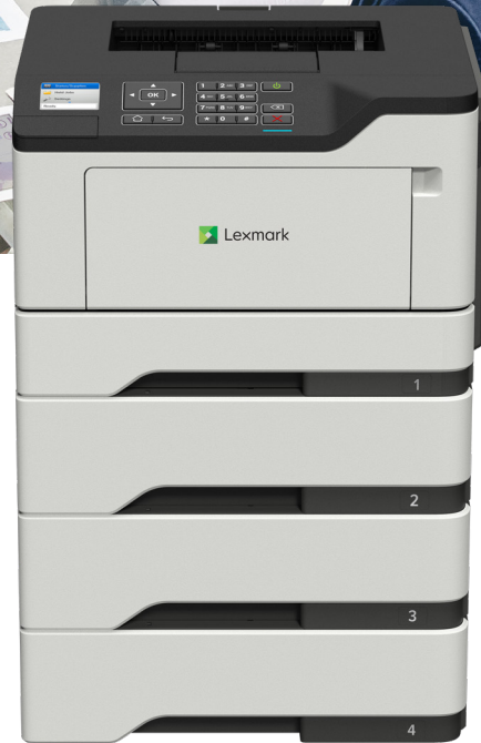
MS521dn con bandejas opcionales

Confiabilidad. Seguridad. Productividad.